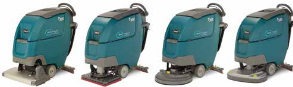
Doble cilíndrico: 20 pulg./500 mm

Las restregadoras T300 cuentan con varios tipos de cabezales para la máquina que se adaptan a sus aplicaciones de limpieza y optimizan el rendimiento de limpieza para áreas específicas.