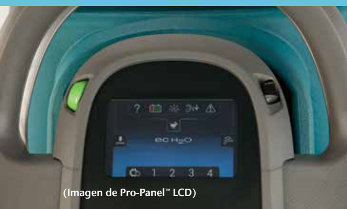
(Imagen de Pro-Panel™ LCD)

La restregadora T300 junto con el sistema de protección para pisos duros 3M™ ofrecen un proceso completo para el cuidado de los pisos que les devuelve la belleza natural a sus pisos de piedra porosos y les brinda un brillo asombroso y duradero.