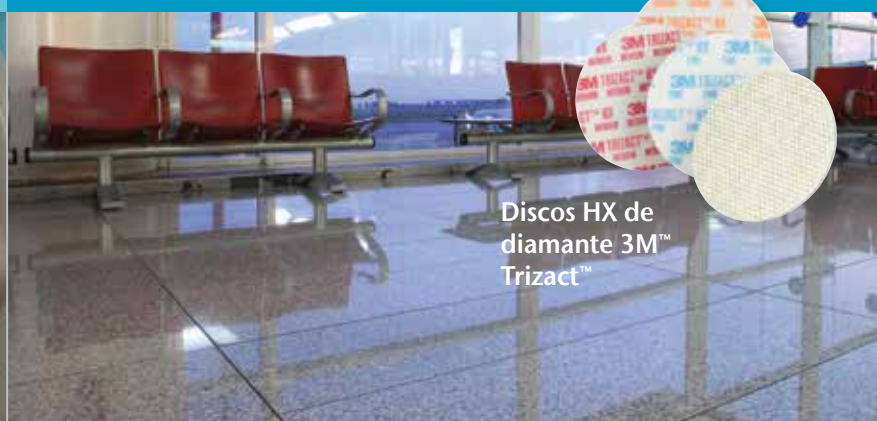
Discos HX de diamante 3M™ Trizact™